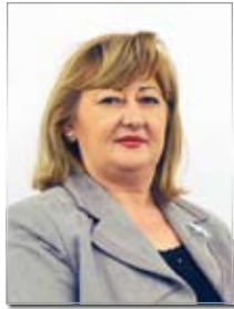
Piše: Biljana Trifunović